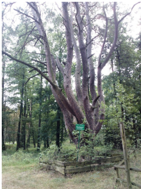
Fot. 1. Pomnik przyrody w gminie Brody o nazwie „Ośmiornica” Photo 1. Natural monument in the municipality of Brody called "Octopus"