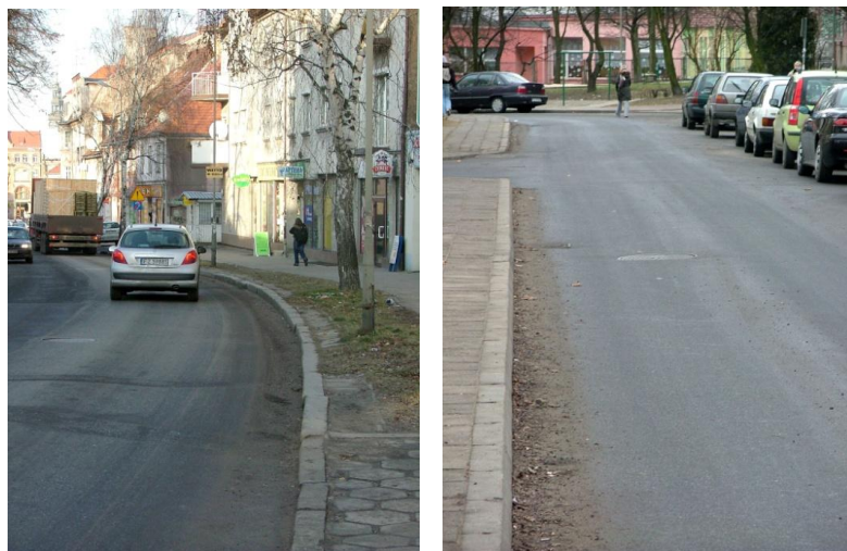
Fot. 1-2. Miejsca poboru próbek pyłu drogowego; ul. Gen. H. Sikorskiego oraz ul. Zamenhofa

W pobranych próbkach pyłu drogowego zawartość substancji ropopochodnych oznaczono z wykorzystaniem chromatografu gazowego Shimadzu. Skład granulometryczny oznaczono metodą Casagrande w modyf. Prószyńskiego, zgodnie z normą PN-R 04033.