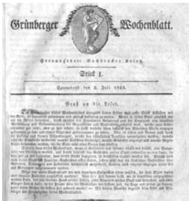
Strona tytułowa pierwszego numeru „Grünberger Wochenblatt” z 1825 r.