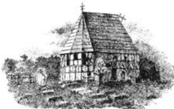
Kościół św. Trójcy, zwany polskim