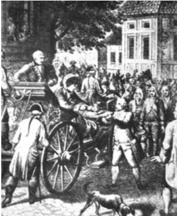
Burmistrz Zielonej Góry częstuje winem Fryderyka II

Nie wszyscy jednak pochlebnie wyrażali się o miejscowym trunku, który znany był ze swojego wyrazistego smaku. Sam król Fryderyk II w czasie wizyty w mieście odmówił poczęstunku winem, uzasadniając swoją decyzję słowami: „Tak, z pewnością, może jest ono dobre, ale tylko dla tych, którzy nie muszą go pić, poza tym lepiej wygląda niż smakuje” 27 .