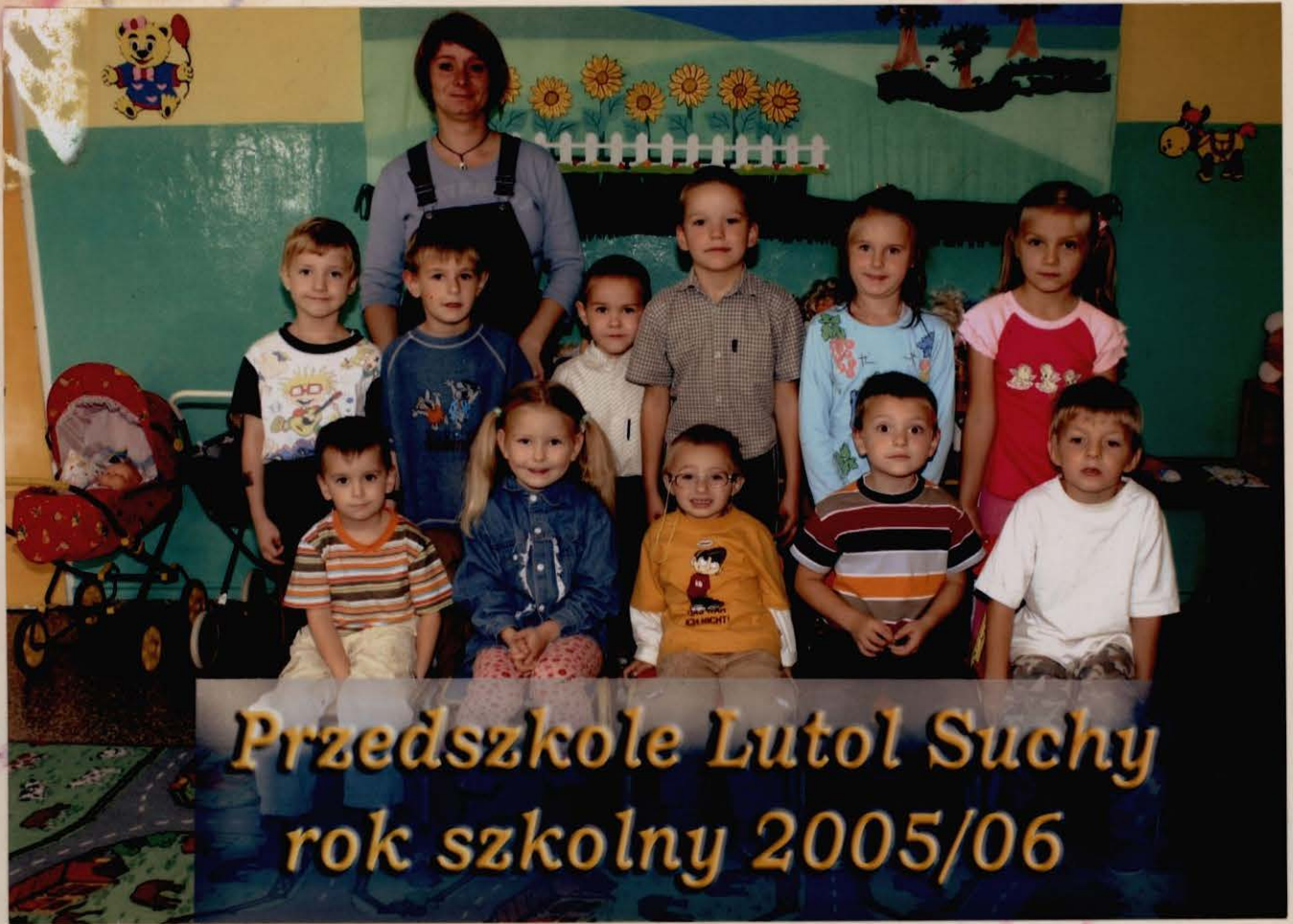
Przedszkole Lutol Suchy rok szkolny 2005/06