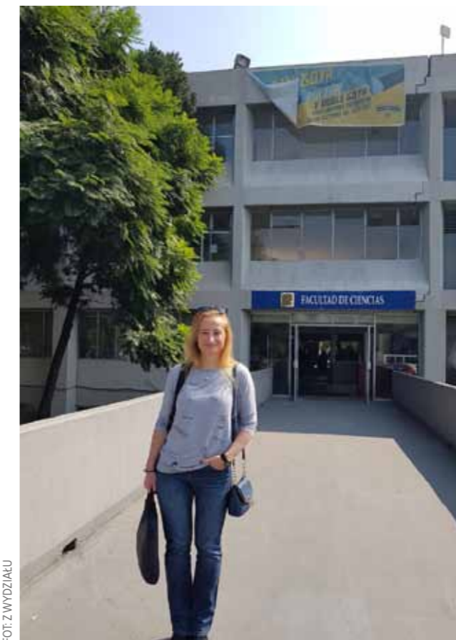
FOT. Z WYDZIAŁU