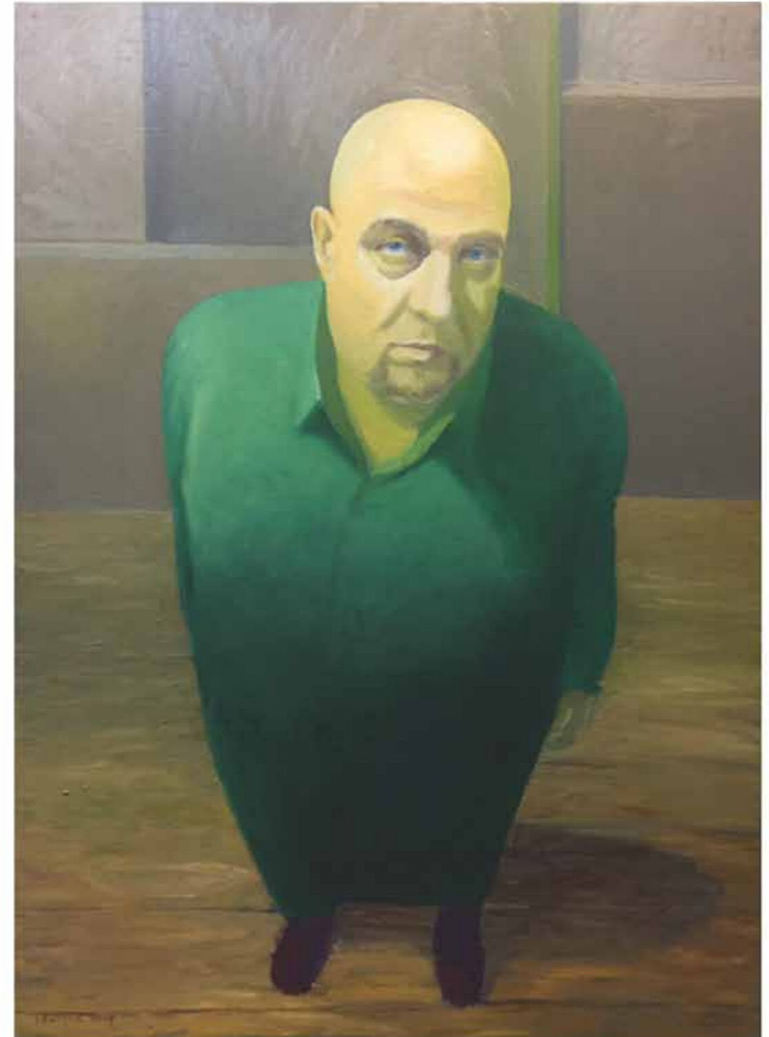
JAROSŁAW ŁUKASIK, Hand made selfie, v.2.0, 2017, olej na płótnie, 140 x 90 cm

koleżanki i koleżdy z Biura Rektora Uniwersytetu Zielonogórskiego