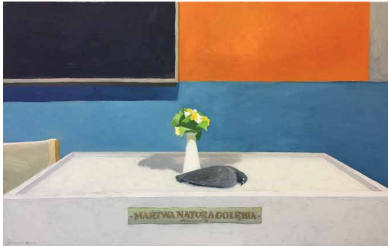
JAROSŁAW ŁUKASIK, MARTWA NATURA GOŁĘBIA, 2017, OLEJ NA PŁÓTNIE, 116 X 73 CM