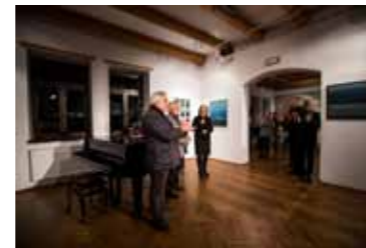
WERNISAŻ W MAŁEJ GALERII W NOWYM SĄCZU, FOT. PIOTR DROŻDZIK