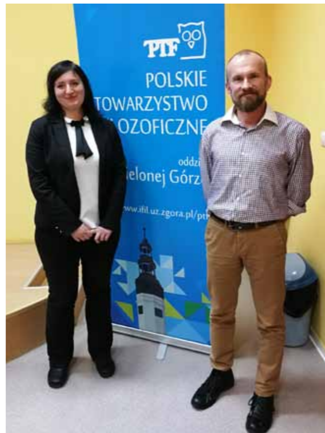
FOT. Z WYDZIAŁU

Kolejną postacią, którą przedstawiła mówczyni była Mary Astell, która głosiła kontrowersyjny pogląd jak na tamte czasy, że za mniejszą sprawność intelektualną kobiet ponosi