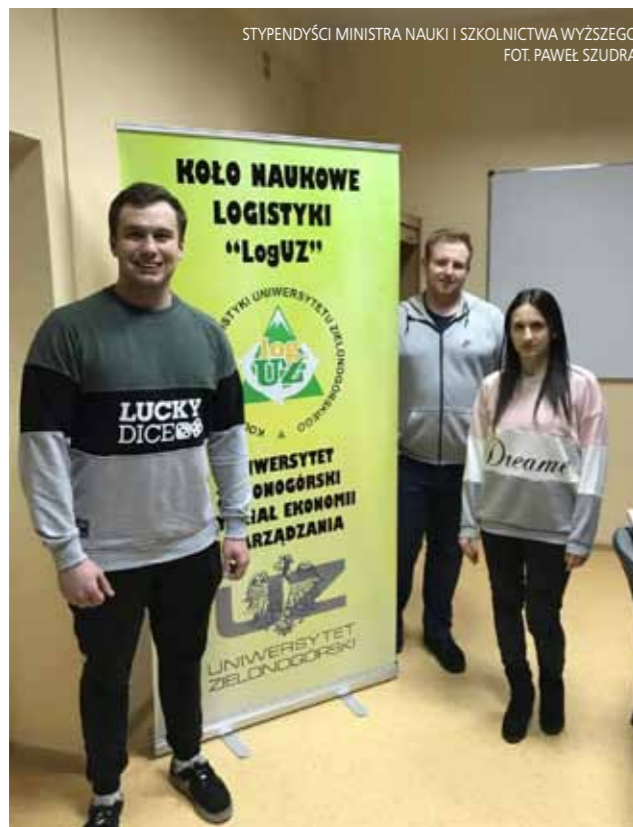
STYPENDYŚCI MINISTRA NAUKI I SZKOLNICTWA WYŻSZEGO