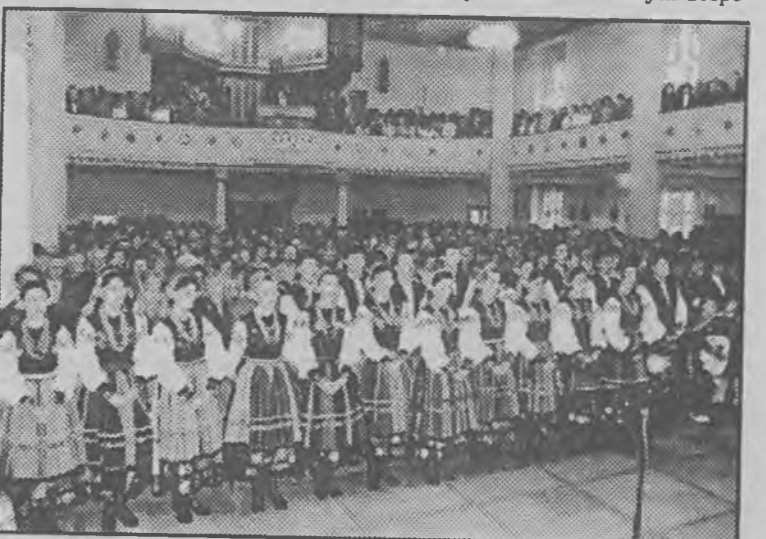
Nie był to tradycyjny koncert.