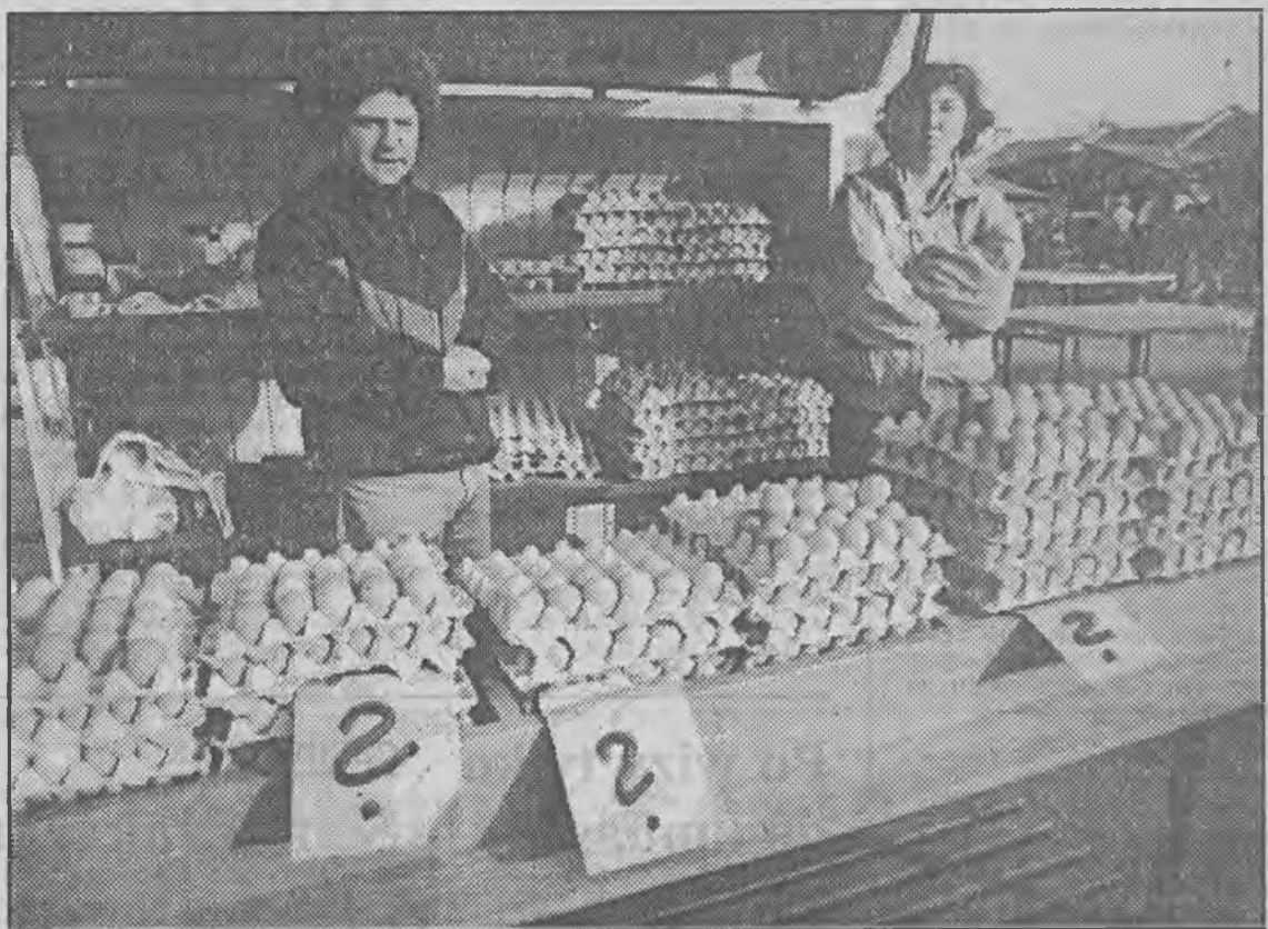
Importowane jaja można kupić za 800 zł. Czy krajowi producenci wytrzymają konkurencję?

Jaja z państw dawnego Związku Radzieckiego są tańsze. W 1992 r., wprowadzono na granicy tzw. oplatę wyrównawczą w wysokości 300 zł od sztuki. Na jakiś czas import został zahamowany. Ponieważ koszty produkcji jaj w Polsce w ciągu roku rosły, więc cena wy-