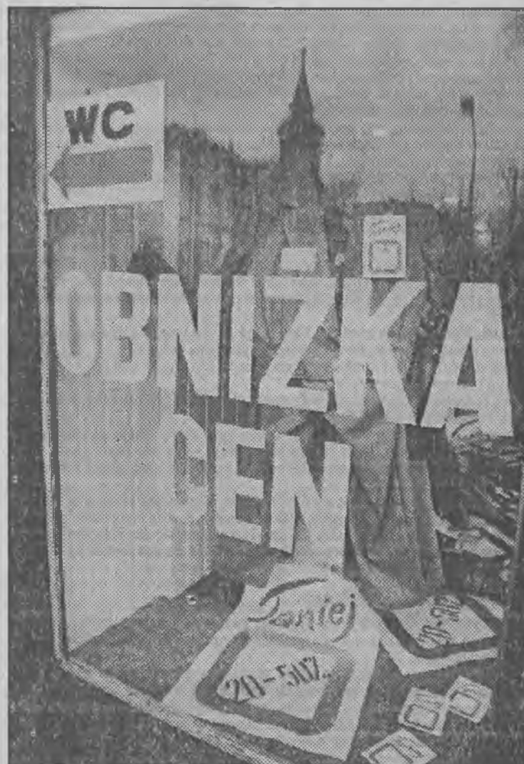
Jeszcze wczoraj rano (18.02) z witryny Domu Towarowego "Centrum" w Zielonej Górze można było dowiedzieć się, że w toalecie wprowadzono obniżki cen.