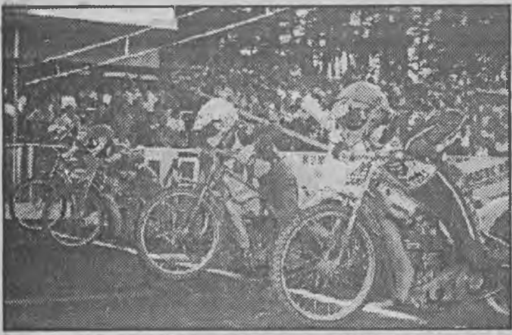
Już tylko ponad miesiąc i taśma pójdzie w górę.