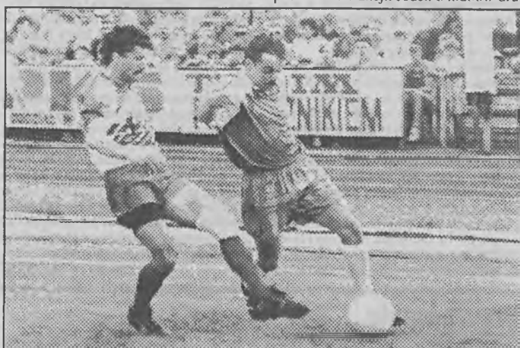
Grali jak potrafili, ale jesienią runda mistrzostw ekstraklasy nie była piłkarskim wydarzeniem. Miejmy nadzieję, że wiosną będzie lepiej.

dze grają tzw. dublerzy polskiej narodowej jedenastki. Właśnie wyjechali oni do Ameryki Płd. na pierwszy prawdziwie ciężki egzamin. Po meczach z Argentyną, Urugwajem i Ekwadorem otrzymamy pośrednią