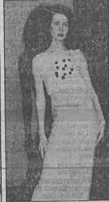
ca, którego wyrażana jest idea. Przede wszystkim jednak jest to chęć wyrażania silnego poczucia odrębności. Pewnego konfliktu między artystą a otoczeniem, z którego powstają pomysły, wizje, propozycje. Jest to również bunt przeciw zastanym kanonom estetycznym i zasadom gustu. Można wyczuć w twórczości tej projektantki znużenie

— stała czytelniczka „Wolnego Kwadratu”.