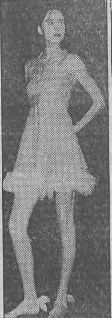
Z drugiej strony ekstrawagancja w pełnym tego słowa znaczeniu. Zwarowane, dziwne, niespotykane i zaskakujące linie sprawiały wrażenie przewrotności. Wielość wariantów mogła budzić podziw.

Z jednej strony dążenie do prostoty: modelki o ciekawej urodzie, przesadnie eksponujące swą naturalność, ale tak pewnie miało być. Każda w sposobie zachowania miała swój własny styl. Jedną mrużyła oczy, od oślepiającego światła reflektorów, inna nie bała się poprawić włosów lub chodzić zupełnie niedbale. Żadnej pretensjonalnej damskości — dziewczęta chodziły boso, u stóp miały jedynie rajskie ostrogi przypominające skrzydła Pegaza. Jeśli biżuteria, to korale z teksturowych, srebrnych rybek nanizanych na nitkę. Kreacje słodko-lagodne, bardzo romantyczne, subtelne. Delikatne proste linie. Harmonia osiągnięta dzięki zestawieniu bieli i szarości. Modelki wyglądały jak anielskie istoty, zupełnie nie z tego świata.