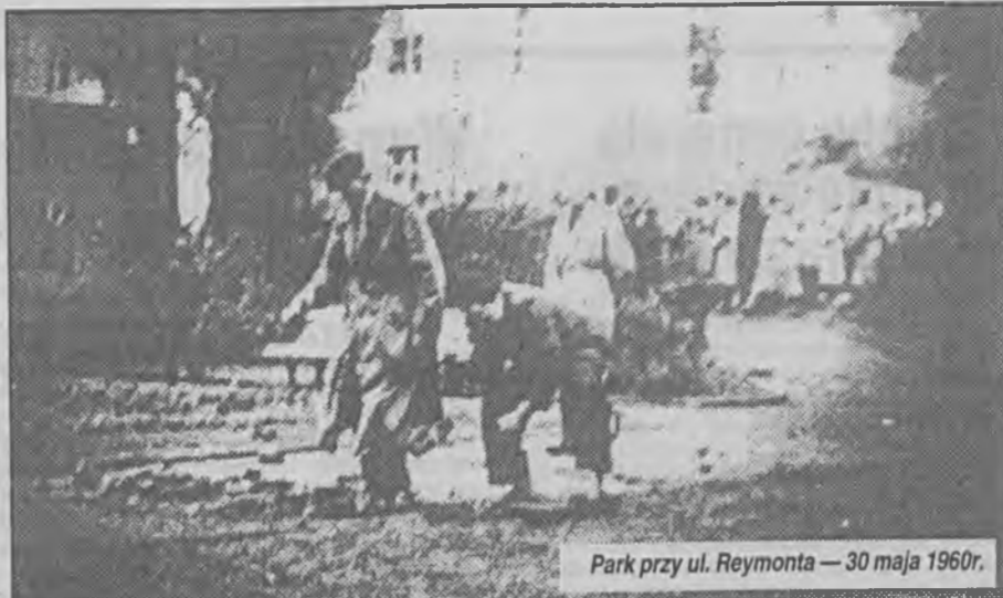
Park przy ul. Reymonta — 30 maja 1960r.

— Niestety, w sprawach "wypadków zielonogórskich" akta sądowe zostały po dwudziestu latach spalone. Mamy natomiast wykazy spraw, materiały podręczne służby bezpieczeństwa, akty oskarżenia i sprawozdania prokuratury wojewódzkiej.