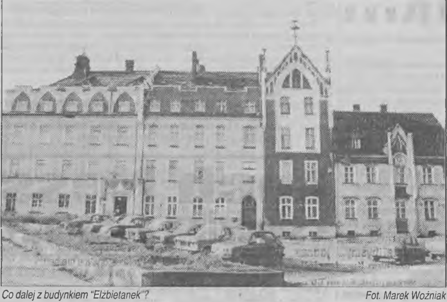
Co dalej z budynkiem "Elżbietanek"?