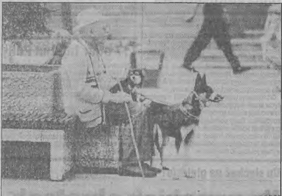
Wierni przyjaciele - pomogą i obronią.