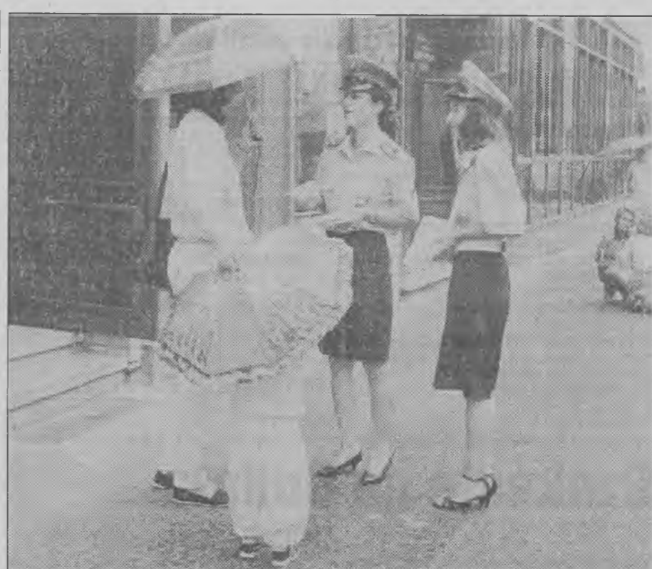
Tym razem to nie mandaty, lecz zaproszenia na europejskie święto policji, które wręcały przechodniom sympatyczne policjantki.