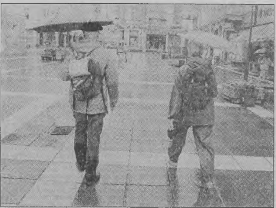
Trochę mżawki nie zaszkodzi.