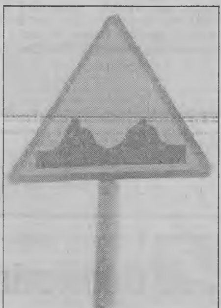
Przy ul. Wrocławskiej stoi sobie taki znak — z podtekstem erotycznym. Nikt tu niczego nie domalował. Po prostu zarzewiały sruby i kompozycja uległa nieznamiennej zmianie.