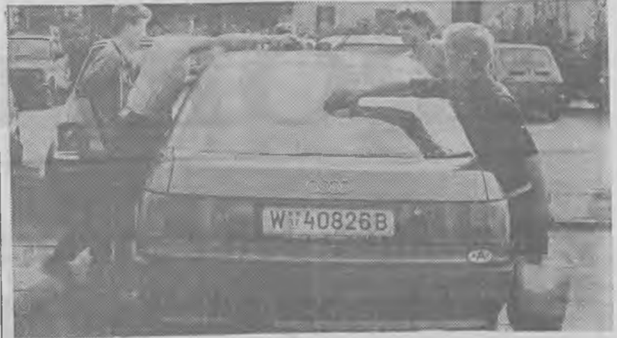
Na parkingu przy ul. Westerplatte można zarobić na myciu samochodów. Nie wszyscy jednak z takich "latających" myjni są zadowoleni.