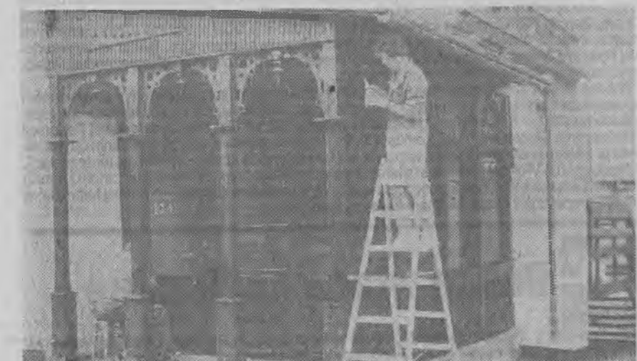
W tym obiekcie przy al. Niepodległości będzie ponownie kwiaciarnia.

Komenda Wojewódzka OHP w Zielonej Górze przyjmuje zgłoszenia indywidualne i grupowe na obozy i kolonie letnie organizowane w terminie od 6 lipca do 1 sierpnia. Informacje i zapisy ul. Piaskowa 1, tel. 702-15. (bkm)