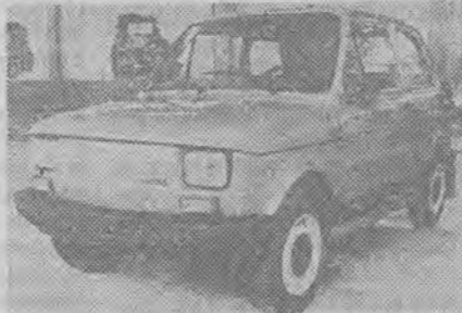
POLSKI FIAT 126P