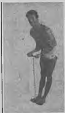
Wzmacnia mięśnie grzbietu, poprawia talię