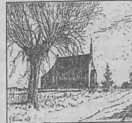
Łaż. Nieistniejąca już dziś kaplica cmentarna w rysunku P. Reicha z 1928 r.