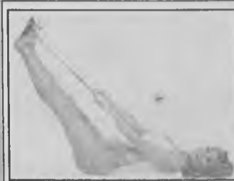
pomaga odzyskać dobrą figurę po porodzie