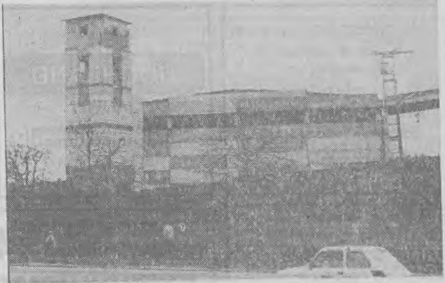
Rozbudowa Zielonogórskich Wódek trwa.