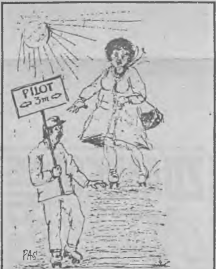
Rys. Adam Piotr Szywała

światowych dam pozostawał... zapach. "Palo-ma Picasso" mieszała się z "Samsarą" Guerlaina i "Gabriellą Sabatini". Nie chcę nikogo pognebiać, ale na "Wild Musk", "Masumi" i "Smitty" Coty'ego nikt nie zwracał uwagi. Były zbyt powszednie.