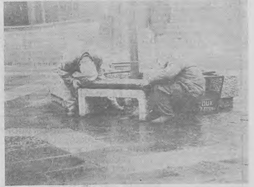
Jedni psują — drudzy naprawiają deptakowe laweczki.