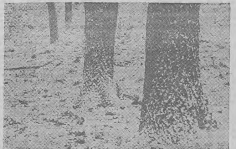
Drzewa marzną stojąc...

Od autorki: Cenę podała Pan te samą; nakład