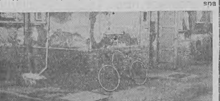
Fragment odrapanej kamienicy przy ulicy Traugutta w Iłowie.