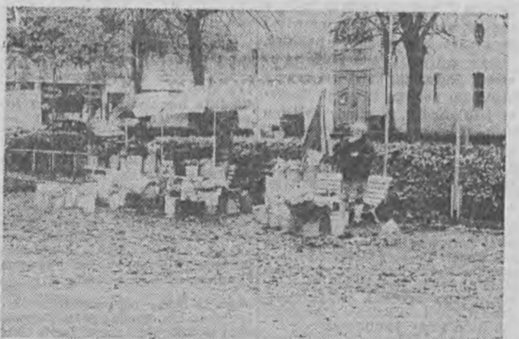
Poranek na targu kwiatowym

Klub Turystyki Górskiej „Watra” organizuje w dniach 9-11 listopada wyjazd na Pogórze Kaczawskie (okolice Złotoryi).