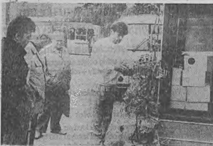
Który kaganiec będzie najważniejszy?