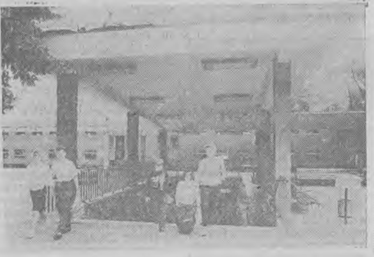
Fot. Marek Woźniak