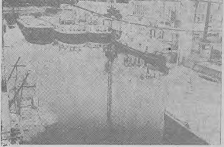
Tak wygląda najbliższe sąsiedztwo mostu.