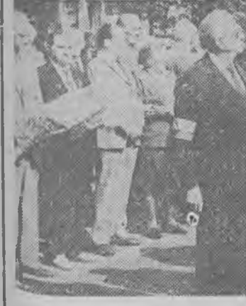
W sobotę na placu Bohaterów w Zielonej Górze odbyły się uroczystości związane z pięćdziesiątą rocznicą powstania Armii Krajowej.