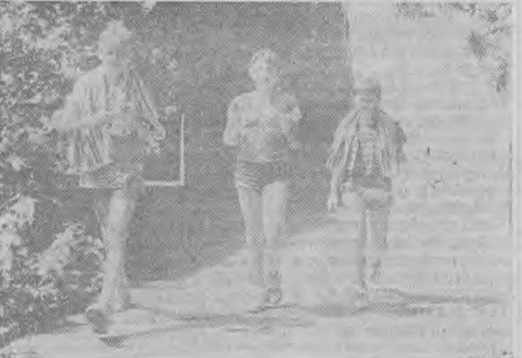
Fot. Marek Woźniak