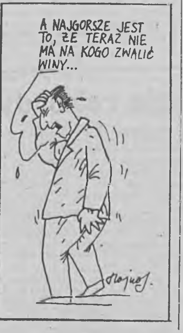
Rys. M. HAJNOS

Pogotowie Policyjne 997 Straż Pożarna 998 Pogotowie Ratunkowe 999 Pogotowie Energetyczne 991 Pogotowie Ciepłownicze 993 Pogotowie Wodn.-Kan. 994 Pogotowie Gazownicze 992 Informacja PKS 223-01 Informacja PKP 23-38 Szpital Wojewódzki centr. 42-61 Bank Informacji Gospodarczej Przedsiębiorstw 652-23 Bank Informacji Usługowej 293-43 „VITA” Domowe Wizyty Lekarskie 59-62 TON COLOR — Naprawa telewizorów 1 video 728-84