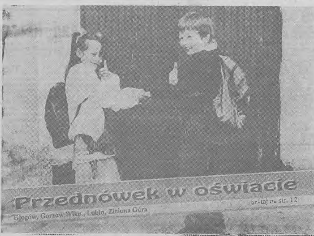
Przednówek w oświacie Głogów, Gorzów Wlkp., Lubin, Zielona Góra

Dziś rozpoczęcie roku szkolnego. Ogólnopolska uroczystość rozpoczęła się o godz. 9.30 w Świętynie — miejscowości w gminie Wolsztyn.