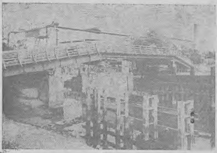
Most zwodzony na kanale przy stoczni rzecznej w Nowej Soli... jest zamknięty z powodu remontu.