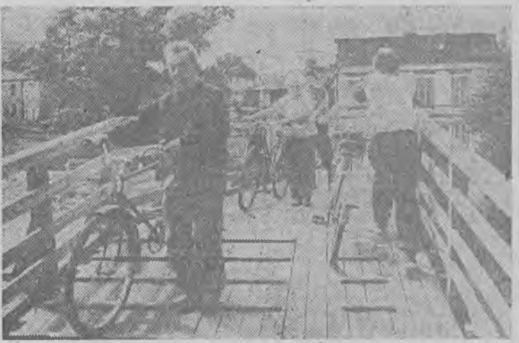
Na szczęście czynna jest kładka. Czytelnicy pytają, kiedy prace remontowe zostaną zakończone? Chodzi przecież o skrócenie drogi ze Śródmieścia nie tylko na działki, ale także w kierunku Ślawy i Wolszyna.