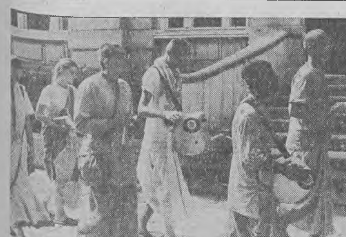
Można ich było we wtorek spotkać na deptaku. Grając i śpie- wając, szli tancującym krokiem, ożywiając smętną z powodu upa- du atmosferę Starówki. Częstowali smakołykami, które (jeśli do- brze zanotowaliśmy) nazywały się symplisy, purisy, pulio. I zapra- szali na spotkanie z ruchem Hare Kryszna. Degustacja kosztowa- ła (kto zasłuchaniu niektórych) 2 tys. zł. Spotkanie w Estradzie — 15 tys. A swoją drogą — czy ten skwar, który się z nieba le- że, da nam wreszcie nieco odetchnąć?...

Jak się dowiedzieliśmy — bę- dzie lepiej. Oto zakupiona zostane „broń gazowa”. „psikacze” środ- ków, z odległości 4 metrów obez- wadniają psą na 10 minut. Mo- żna będzie więc stworzenie bez- piecznej dla ścigającego go i „obojęniejszej” dla niego samego (iż ma serce), zanieść do samo- chodu. (ew)