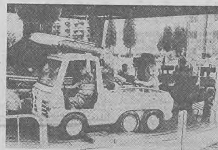
Lunapark przy ul. S. Wyszyńskiego, czeka na dzieci tylko do 11 bm. Oby tylko armatka widoczna w tle, nie wypaliła...

Wszystkich, którzy chcieli- by zasięgnąć porady prawnej, zapraszamy do naszej redak- cji w każdy poniedziałek. Od godziny 16. Nasz radca udzie- la jej bezpłatnie.