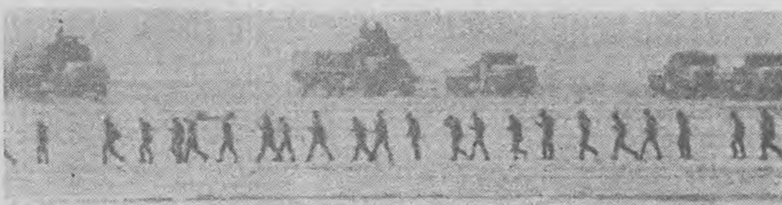
Zolnierzy irackich podaje się tak wielu, że aliancom zaczyna brakować plastikowych kajdanek i materiałów wybuchowych do wysadzania porzuconych bunkrów donosi korespondent AP.

ZSRR uznał wtorkowe poranne oświadczenie Saddama Husajna za wyrażenie nadziei ewakuacji, wyrażającą do tego, by ogłosić zawieszenie broni. Jednak Bush powiedział, że prezydent Iraku nadal