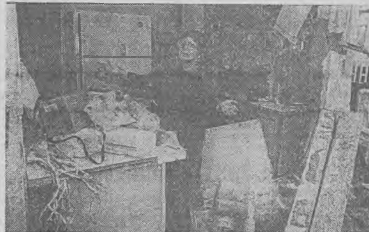
Tak wygląda mieszkanie po wybuchu irackiej rakiety.