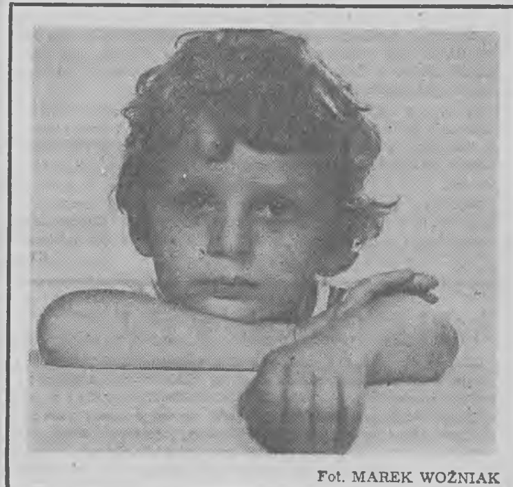
Fot. MAREK WOŹNIAK