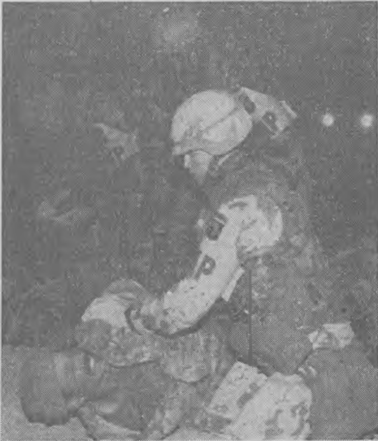
Jeden z 400 irackich żołnierzy wziętych do niewoli przy granicy z Kuwejtem.

Irańska agencja IRNA podała, że siły sprzymierzonych w nocy z soboty na niedzielę rozwinęły gwałtowne ataki powietrzno-rakietowe na miasta położone w południowo-wschodnim Iraku. Według agencji IRNA ataki te rozpoczęły się w sobotę o godz. 18.30 GMT i kontynuowano do 2.45 GMT. Przez całą noc z soboty na niedzielę w irańskich miastach oddalonych zaledwie o 40 km od granicy z Irakiem słyszano potężne wybuchy będące wynikiem bombardowania. Cytując rzeczniczkę irackich sił zbrojnych Radio Bagdad podało w niedzielę, że „armia walczy dzielnie i zadaje ciężkie stra-