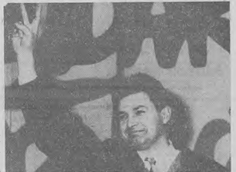
Nowy przewodniczący KK NSZZ „Solidarność” Marian Krzaklewski.