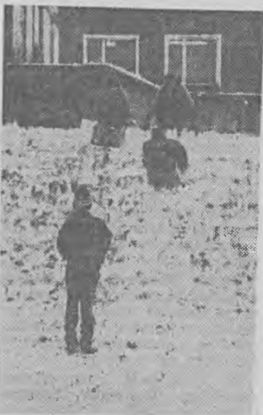
Zima — przyjdź! Dzieciom marzą się prawdziwe, śnieżne ferie. Czy w tym roku spełnią się wreszcie te pragnienia?

Budując domy dla swych pracowników, Zakład Ogrodniczy w Zielonej Górze zapomniał o śmietnikach i porządkach wokół bloków. Lasek, w którym się te bloki znajdują (przedłużenie ul. Batorego, droga do Łężyce) tonie w śmieciach. Papieru, szczytki gazet i kartonów, puszek po piwie i coca-coli, butelek. Krótko mówiąc: raj dla bałaganiarzy z Zakładu Ogrodniczego? (asp.)