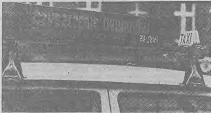
Obok tradycyjnych kogutów, na dachach taksówek coraz częściej można spotkać dodatkowe reklamy. Jak w krajach zachodnich.

Niestety, wielu właścicieli samochodów stosuje przeróżne oznakowanie, niezgodne z obowiązującymi wyżej wykazanymi przepisami. Trzeba zrozumieć, że mimo bezpowrotnego odejścia w historię PRL, obowiązują nasze państwo i jej obywateli normy prawne wywodzące się z porozumień międzynarodowych. Jeżeli teraz można produkować wszystko — nawet te bzdurne plakietki ze znakiem RP, flagą i orłem w dużej koronie — i to wszystko można (jeżeli nie utrudnia widoczności kierującemu) zawiesić, wywiesić itp. w swoim aucie, to proszę jeszcze jednak uwzględnić obowiązujący ponadpolityczny przepis prawa międzynarodowego. KOSTEF