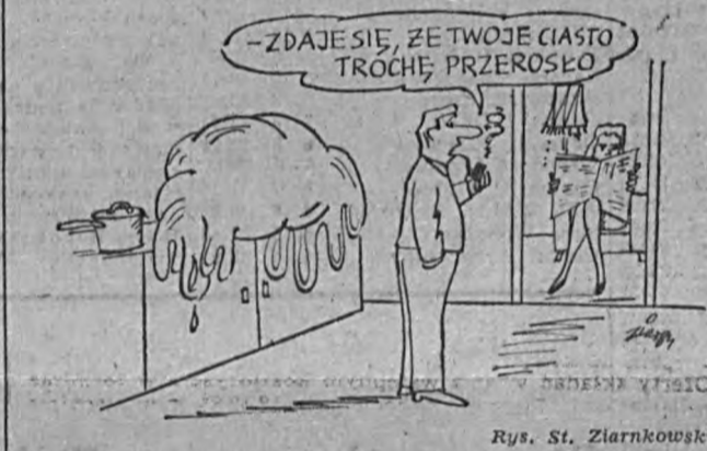
Rys. St. Ziarnkowski