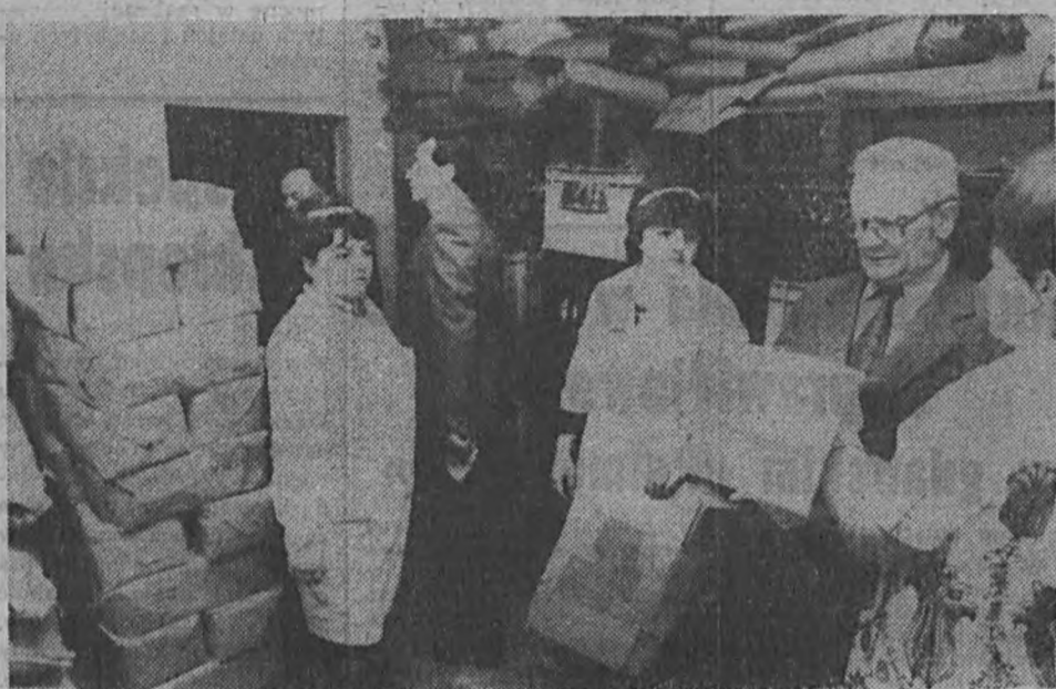
Inspekcja Robotniczo-Chłopska w działaniu

Następnie przewodniczący Rady Państwa, w godzinach przedpołudniowych złożył wizytę w Państwowym Liceum Muzycznym im. Henryka Wieniawskiego w Łodzi, gdzie wziął udział w spotkaniu aktywu dzielnicy — Górna. Odpowiadając na apel PRON o Narodowy Czyn Pomocy Szkole, przedstawiciele zakładów pracy, instytucji, organizacji społecznych i młodzieżowych, podpisali zbiorowe porozumienie o współpracy i pomocy szkołom tej dzielnicy.