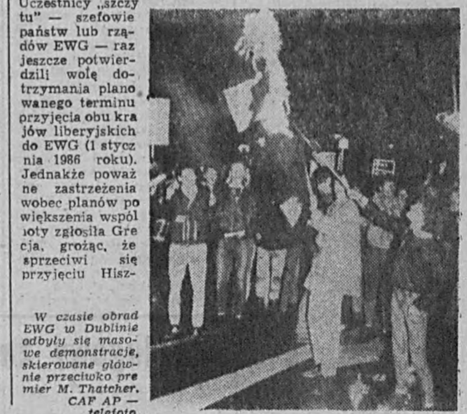
W czasie obrad EWG w Dublinie odbyły się masowe demonstracje, skierowane głównie przeciwko premierowi M. Thatcher.