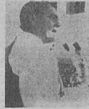
Premier Indii Rajiv Gandhi przewodził kampanii wyborczej i przybył na miejsce tragedii do Bhopalu.

Na miejsce tragedii skierowano po inspekcji premiera Gandhiego 500 lekarzy z in-