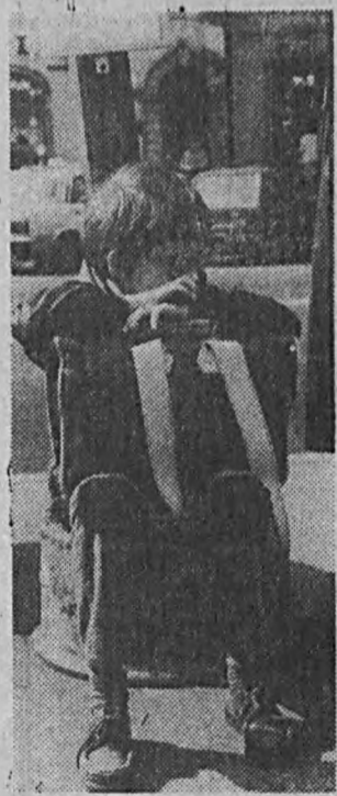
A do wakacji jeszcze tak daleko!