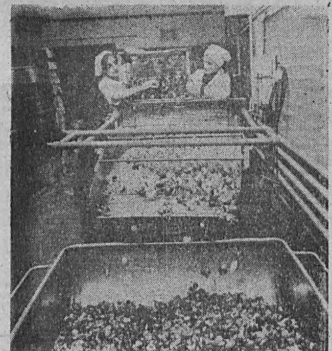
Na zdjęciu: plukanie grzybów przeznaczonych do solenia.

Grzybów jest w bród. Nie spotykamy od lat też urodzaj sprawa, że kto żył pędził do lasu. W niektórych rejonach kraju grzybiarze odstawiają do punktów skupu nawet do 30 t grzybów dziennie. W no wym zakładzie przetwórczym Zielonogórskiego Przedsiębiorstwa Produkcji Leśnej „Las” w Zielonej Górze nie narzekają więc na brak roboty. Sól się tu i suszy grzyby, a także produkuje sałatki grzybowe.