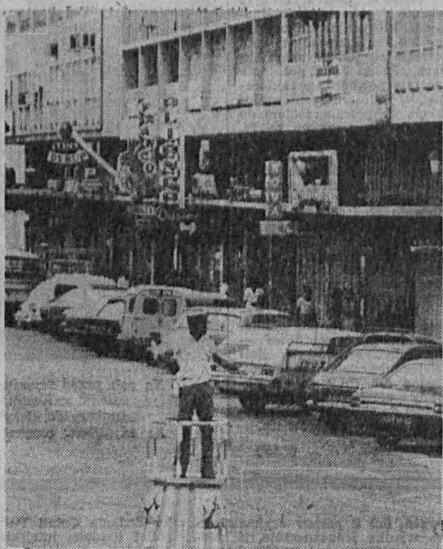
ANGOLA. W centrum Luandy. CAF - Zagodbistki

jemnicze ciało codziennie zmienia swoją pozycję, co skłoniło go do wysunięcia przypuszczenia, iż chodzi tu o planetę, poruszającą się po własnej orbicie.